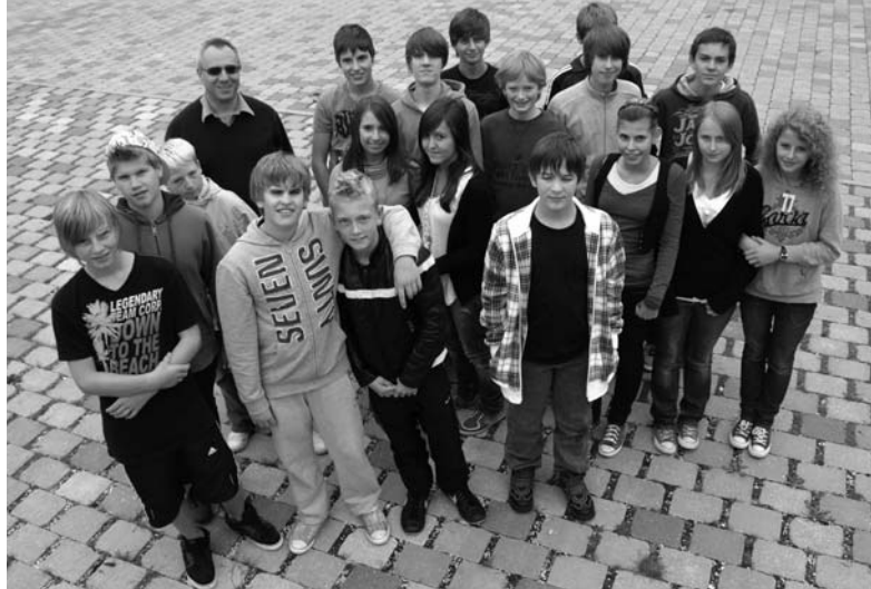
Konfirmation, 22.05.2011 Gruppe A (in alphabetischer Reihenfolge)