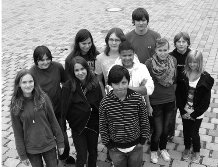
Konfirmation, 08.05.2011 Gruppe A (in alphabetischer Reihenfolge)